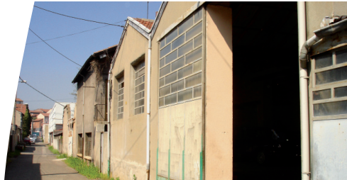
Site Desjoyaux : cette friche économique sera reconvertie en secteur résidentiel

Le Grand Projet de Ville (GPV) de Saint-Etienne a pour objet la rénovation urbaine de quatre quartiers prioritaires de la ville et notamment le quartier du centre-ville du Crêt de Roc (site Desjoyaux en particulier).