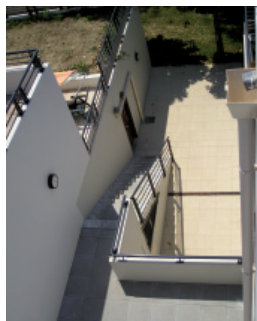
Opération de renouvellement urbain d'un quartier social à Saint-Rambert - Lyon 9e (69), SACVL ; architecte : Laurent Boggio BBC

- Rechercher cette individualité dans les espaces extérieurs privés en assurant une certaine intimité, des accès individualisés aux logements et ceci selon les différentes formes d'habitat : habitat individuel dense, habitat intermédiaire, habitat collectif individualisé.