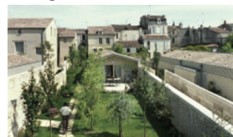
Maisons de ville à Saintes (17), quartier de l'Arc de triomphe. SEMIS ; architectes : Babled - Nourret - Reynaud

- Limiter, voire proscrire les vis à vis, notamment sur les espaces extérieurs : une condition souvent nécessaire à l'adhésion des occupants potentiels aux formes d'habitat individuel dense ou d'habitat intermédiaire.