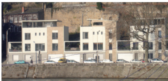
Intégration de maisons urbaines à Lyon, quai des Etroits, SCI Amiral; architecte : Agence BAC Panet-Soulier-Desseigne