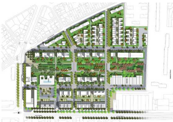
Le quartier Junot à Dijon : une opération de renouvellement urbain en centre-ville dans une démarche d'aménagement durable et une conception environnementale exigée des programmes immobiliers