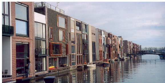
Maisons urbaines à Amsterdam presqu'île de Bornéo, ville d'Amsterdam aménagée. Maîtrise d'ouvrage et maîtrise d'œuvre individuelles pour chaque lot

- Favoriser les processus d'appropriation par les usagers à travers l'individualisation de chaque habitation dans une opération d'individuels groupés par exemple ou d'un groupe de logements dans une opération d'ensemble d'habitat collectif ou intermédiaire.