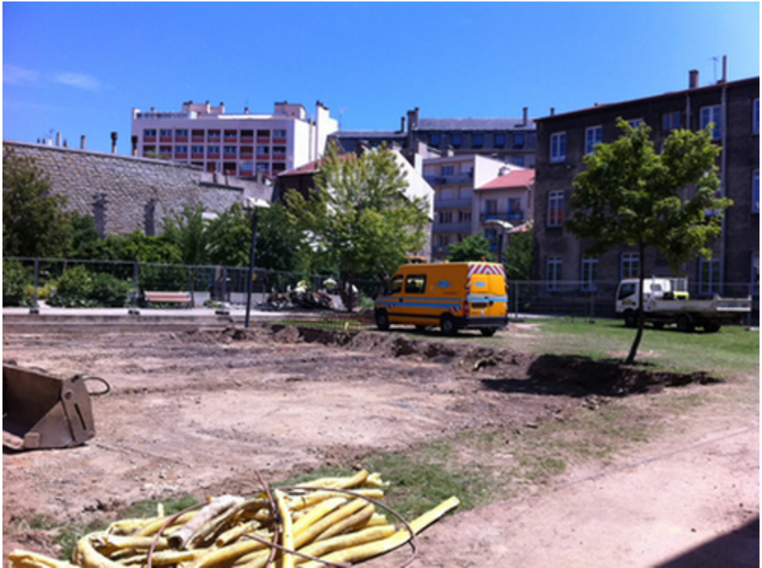
Square Joseph Hauptmann, Saint-Etienne, 2011